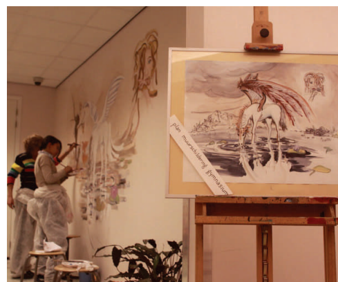
Werk in uitvoering

Gymnasium Sint-Montfort Montessoriweg 55 3083 AN Rotterdam 010—485 52 77