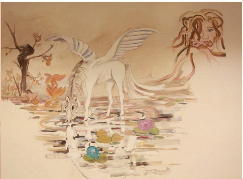
Pegasus en Medusa